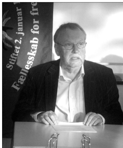
Finn ved efterårs generalforsamlingen 2008