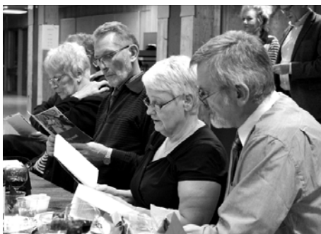
Glade socialdemokrater fra Albertslund og Høje Taastrup