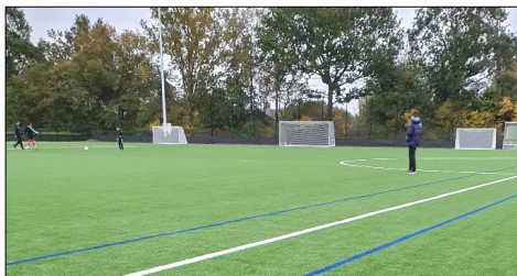
Ny kunstgræsbane til BS72

Der skal ikke være nogen tvivl om, at vi gerne vil have attraktive rammer og faciliteter, og vi er slet ikke i mål endnu. Vi har et stort renoveringsbehov på mange af vores kommunale faciliteter og det kræver, at vi har en økonomi til at gennemføre dette.