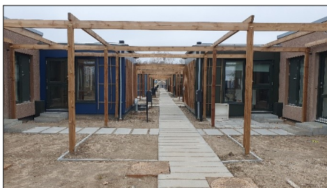
Renovering af Galgebakken

Der skal ikke være nogen tvivl om, at vi gerne vil have attraktive rammer og faciliteter, og vi er slet ikke i mål endnu. Vi har et stort renoveringsbehov på mange af vores kommunale faciliteter og det kræver, at vi har en økonomi til at gennemføre dette.