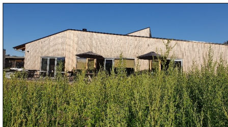
Ny Klub Svanen